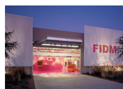
Orange County Campus