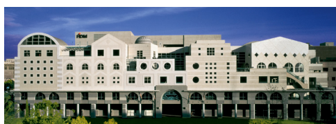
Los Angeles Campus

FIDM ha establecido acuerdos con diversos colegios y universidades para avalar los créditos de intercambio. Contacte a FIDM para más detalles.